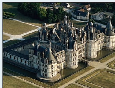
Le château de Chambord est immense, avec plus de 400 pièces et 365 cheminées.

Après la Guerre de Cent Ans et la reconquête de son territoire, la France est finalement en paix. La période qui commence s'appelle la « Renaissance », c'est-à-dire le renouvellement. C'est une période de grande activité artistique et culturelle. C'est à cette époque que les rois de France ont habité en Touraine où ils ont construit de magnifiques châteaux: Chenonceaux , Amboise , Chambord .